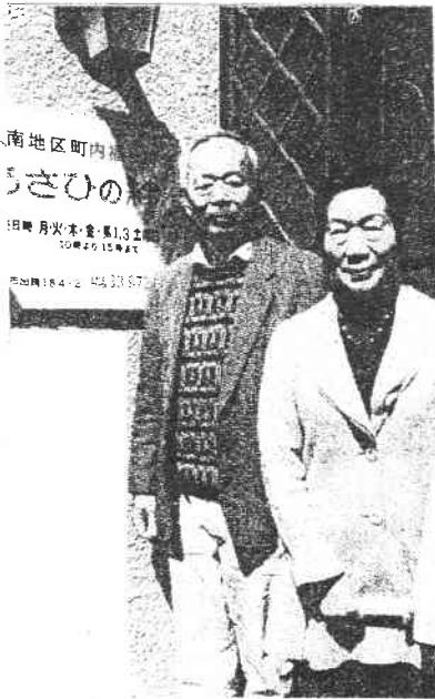
大蔵市長と(拠点にて)

想像を絶する東日本大震災に 対しまして心よりお見舞いを申し 上げます。併せまして1日も早い 復興をお祈りします。このような 大変な中、旭南地区の住民が主 体となり、平塚市と協同して地域 における支えあい活動を行い誰 もが「いきいきと、明るく、楽しく、 安心して暮らせる地域づくり」を 目指して3月20日に市内10番 目の旭南地区町内福祉村「あさ ひの絆」が開所致しました。福祉 村誕生まで多くのボランティアの 方が3年以上の永きにわたり検 討いただきお互いが支え合う「あ さひの絆」が誕生しました。