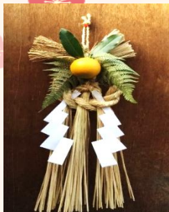
↑ 玉飾り 約 50 cm

2022年正月飾りのご案内 2022年の正月飾りを販売します。お問い合わせは上記の連絡先まで。