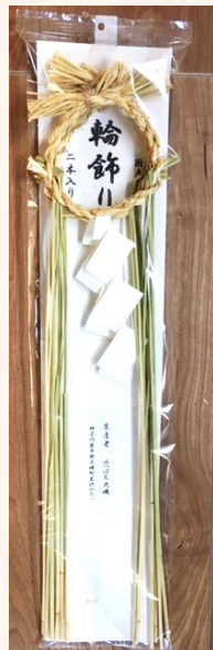
↑ 輪飾り 2本入り