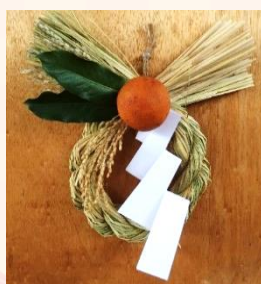
↑ 玄関飾り 約 25 cm