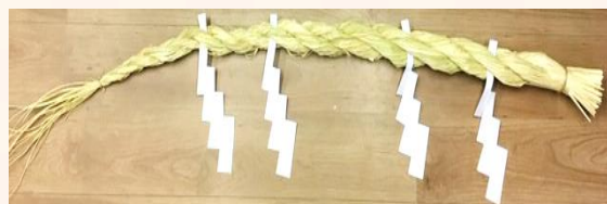
↑ 3 尺しめ縄 約 90 cm