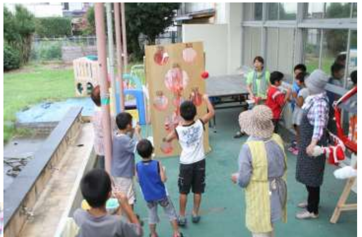
ストライク、ボール入ったかな