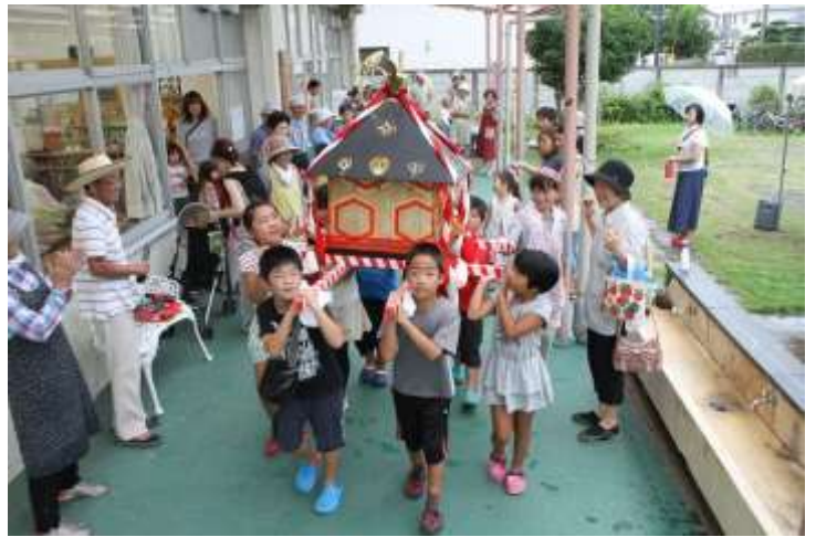
ワッショイワッショイのかけごえにぎやかに

あいにくの雨の中ゲーム（今年初登場のストライクアウト）流しそうめん・セタで作った子供神輿・めだかすくい・とバラエティ豊かな内容になりました。