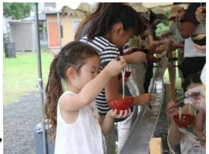
流しそうめんおいし〜い！！