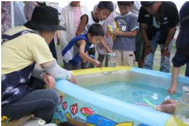
めだか何匹すくえるかな