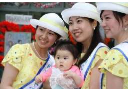
将来の織姫様とこころ

「七夕おどり千人パレード」今年で3回目の参加ふれあいの里のハッピーを着て元気いっぱいボランティアと地域の方々30名で楽しく踊りました