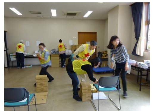
会費増強資材仕分け 30年3月