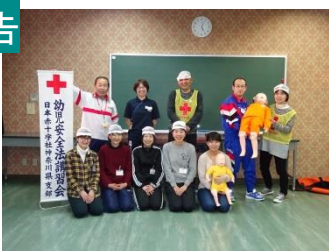
講習集中開催 30年2月