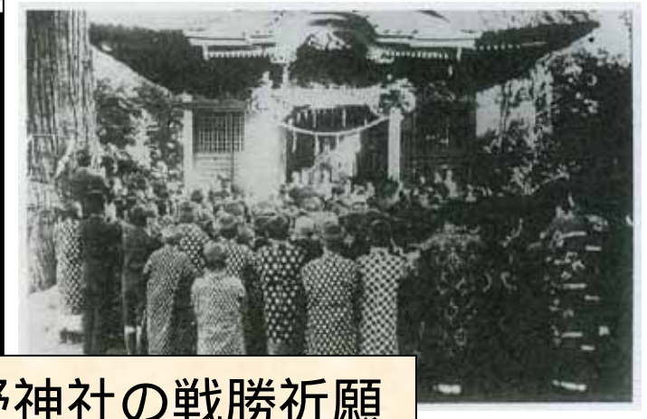
熊野神社の戦勝祈願