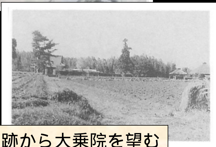
大門跡から大乘院を望む