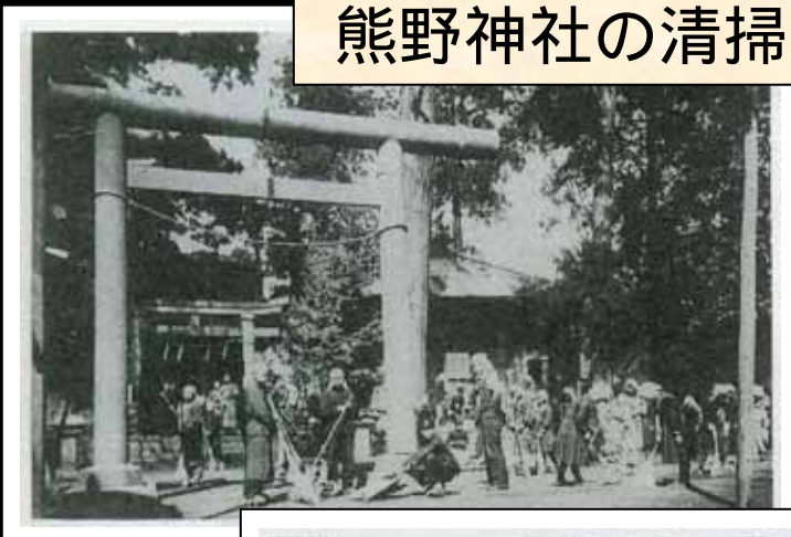
熊野神社の清掃奉仕